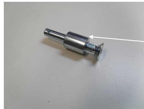
DISTANZIALE LEVA FRENO